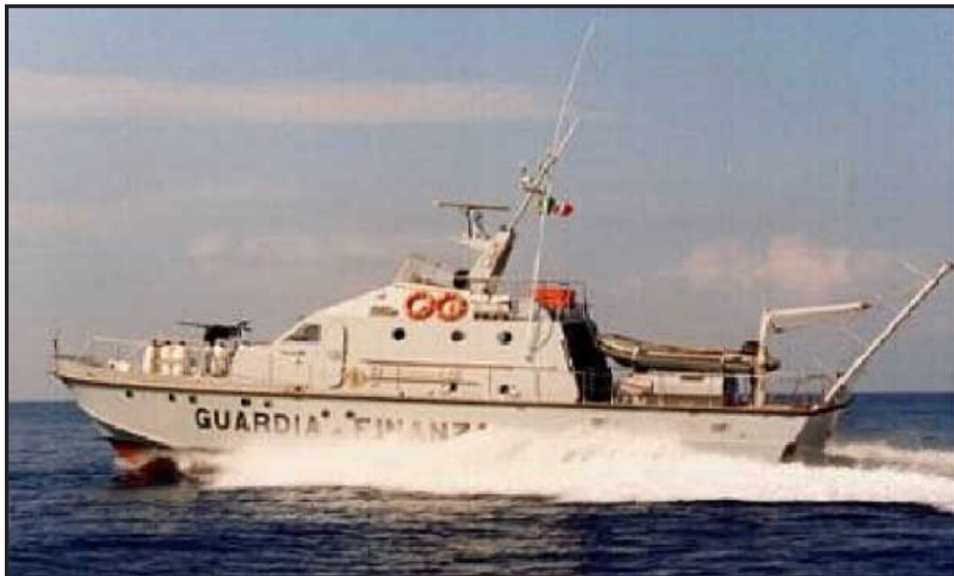
G.64 – DARIDA nelle acque del Golfo di Gaeta

Per onorare l'unità guardacoste della Guardia di Finanza, "G.64 – DARIDA", che ci ha ospitati per le operazioni IIØIADU/MM, di sabato 24 settembre, voglio fornire, di seguito, delle brevi informazioni sulla stessa.